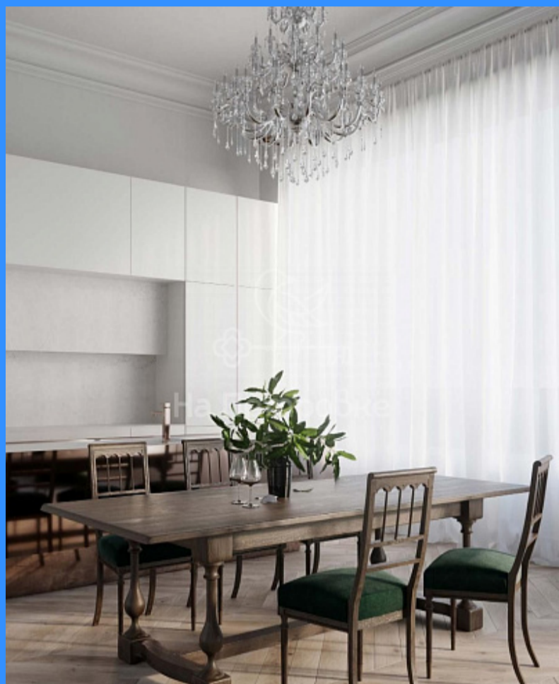
Image not found Россия, Москва, улица Большая Дмитровка, 9с1 kvartus_object